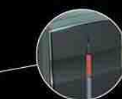
警戒ボタン (ON で警戒中は赤色に光ります)