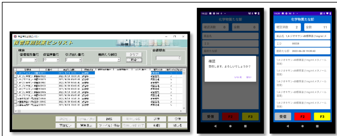
開発画面 一部抜粋